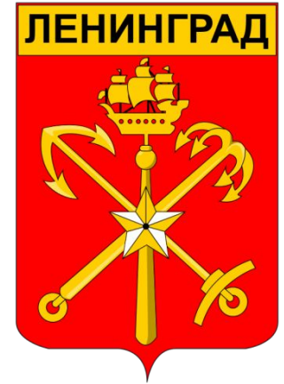
Один из вариантов герба Ленинграда в Советский период до 1991 года