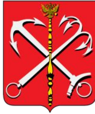
Герб Санкт-Петербурга с 1730 по 1856 год