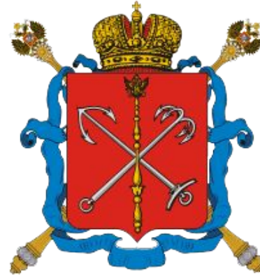
Герб Санкт-Петербурга XIX века до революции 1917 года