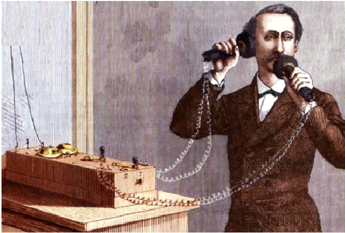
Телефонний апарат Белла (1877 р.)

У цей час набувають розвитку такі засоби масової комунікації (масмедіа), як преса (газети, журнали, книжки), радіо, телебачення, кінематограф, реклама та ін.