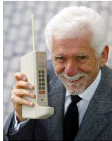
Мартін Купер американський інженер і фізик, який у 1973 р. здійснив перший дзвінок по мобільному телефону. В руках у нього одна з перших моделей стільникового телефону

Масова комунікація (англ. mass communication ) — процес одночасного та швидкого поширення інформації на великі спільноти людей за допомогою засобів масової інформації (преси, радіо, телебачення, кіно, Інтернету).