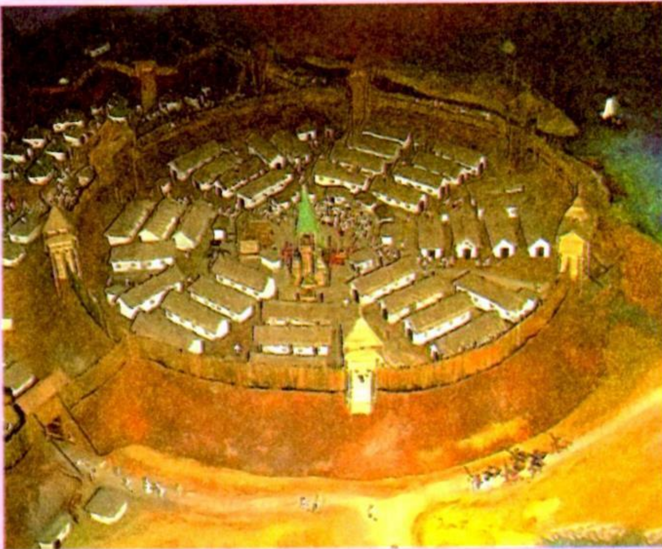
Макет Запорозької Січі в Музеї історії запорозького козацтва в м. Запоріжжі