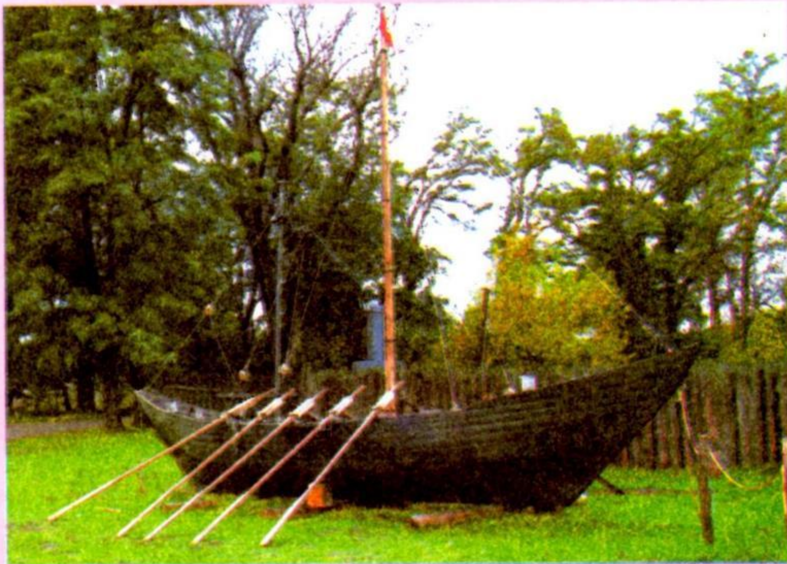
Козацька чайка (сучасна реконструкція). Музей історії запорозького козацтва в м. Запоріжжі