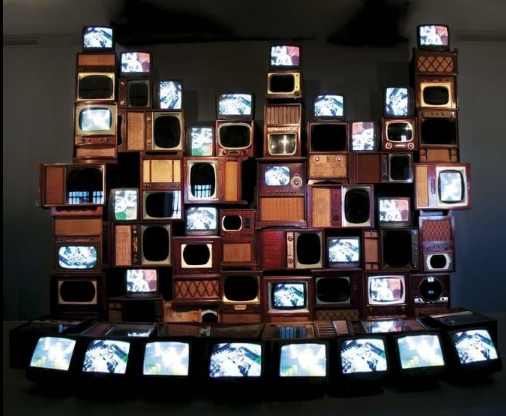
Nam June Paik, Mirage Stage, 1986,

На відміну від комерційного телебачення, митці намагалися використати медіа таким чином, щоб використовувати — якщо не критично досліджувати — його найвиразніші формальні риси жвавості, інтимності та безпосередності, а також його потенціал для спільної комунікації.