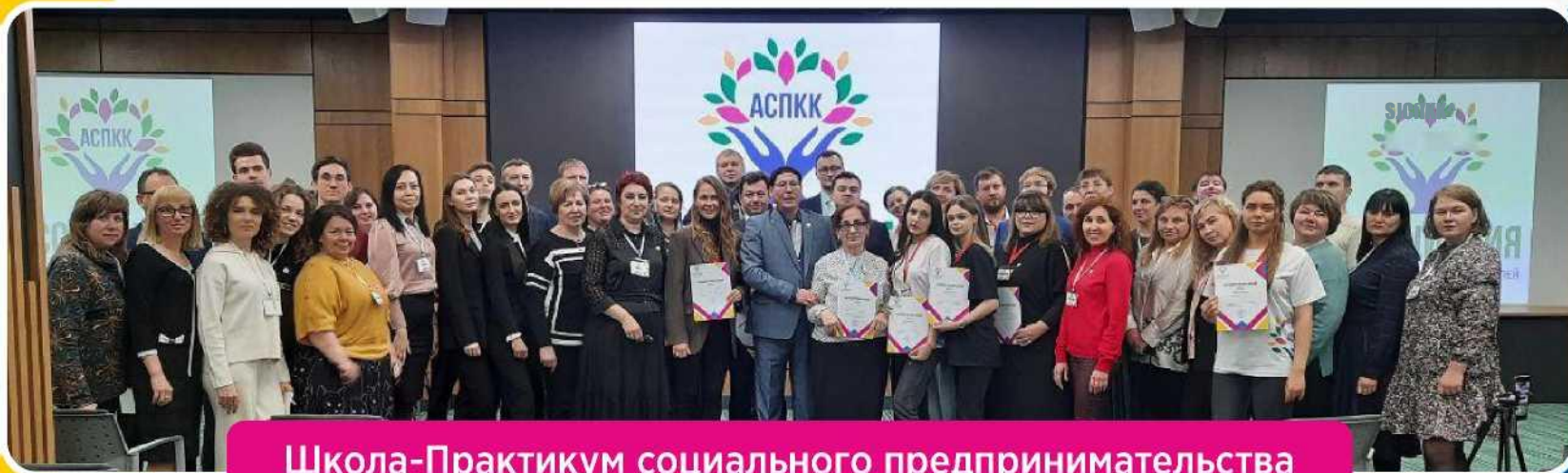
Школа-Практикум социального предпринимательства в муниципалитетах Краснодарского края