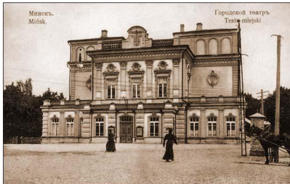
Здание Минского городского театра, в котором работал съезд