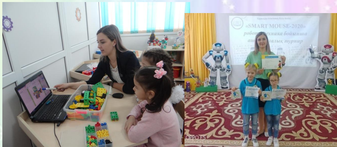
Кружок робототехники «MOUSE мышь»