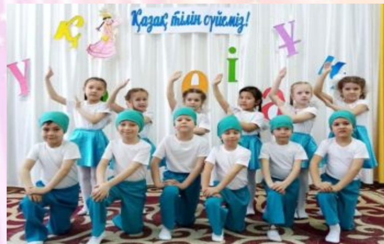
Кружок «Азбука танца»