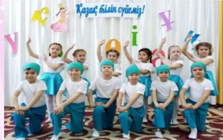
Кружок «Азбука танца»