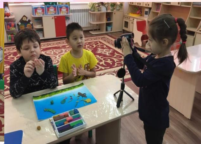
Кружок «Творческая радуга» «Пластилиновый мультик»