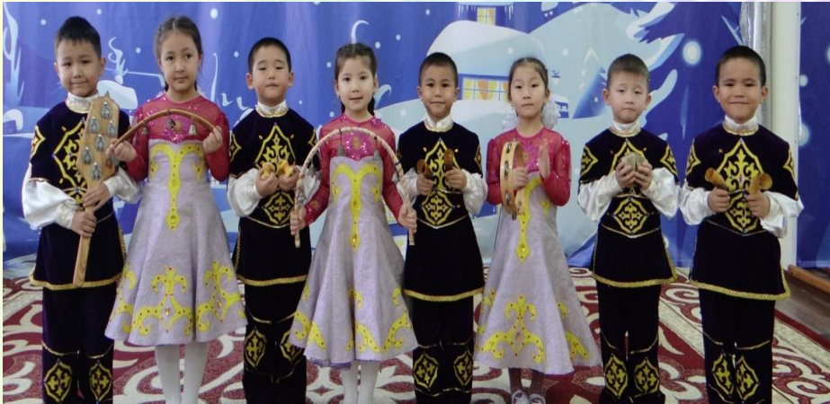
«Веселые «Шумелки» оркестр