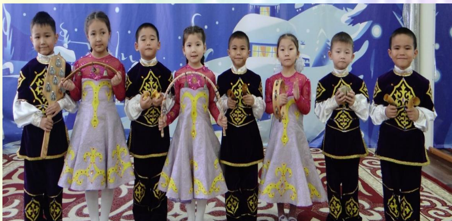
«Веселые «Шумелки» оркестр