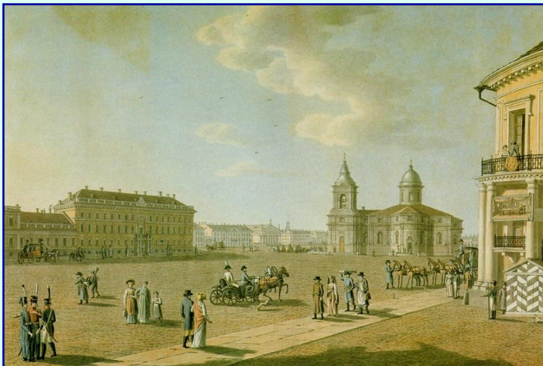
Петербург 19 в.

В 1832 г. введено ограничение на доступ в дворянское сословие лицам из «податных сословий»: введены звания почетных граждан и потомственных почетных граждан . Почетные граждане получали ряд привилегий (освобождались от рекрутской повинности, телесных наказаний, подушной подати), но не могли владеть крепостными крестьянами (как дворяне).