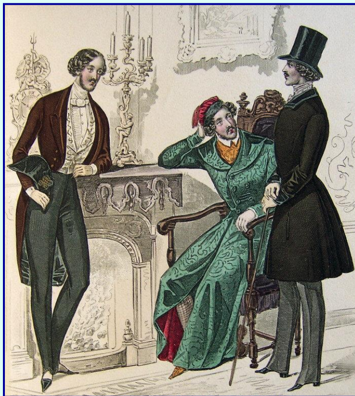
Российские дворяне середины 19 в.

Обеспокоенный начавшимся еще при Александре I разорением дворянства, Николай запретил дробить крупные имения (от 400 дворов), при наследовании - они передавались старшему в роду. Был повышен имущественный ценз для участников выборов дворянских органов самоуправления.