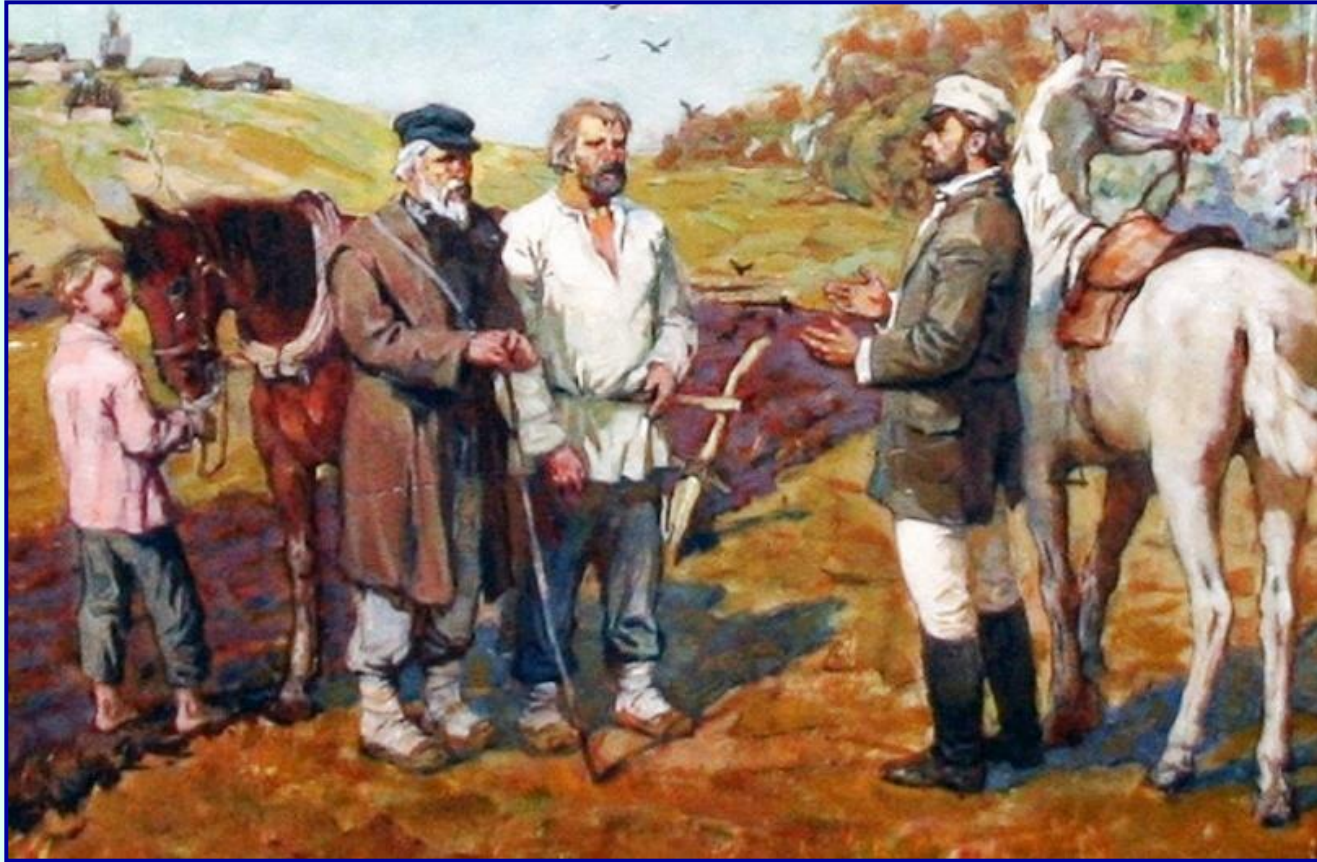
Крепостные крестьяне 19 века

В 1842 г. был принят указ об обязанных крестьянах – помещикам предоставлялось право по своему желанию освобождать крестьян, заключая с ними договор о предоставлении земельных наделов в наследственное владение. За это крестьяне обязаны были выполнять различные повинности в пользу бывших хозяев.