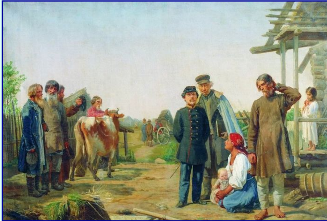
Крепостные крестьяне 19 века

Реформа П.Киселева усилила различия между положением государственных и крепостных крестьян, что вызвало недовольство помещиков. Николай I понимал, что немедленное устранение крепостничества грозит протестом со стороны приверженцев крепостного права.