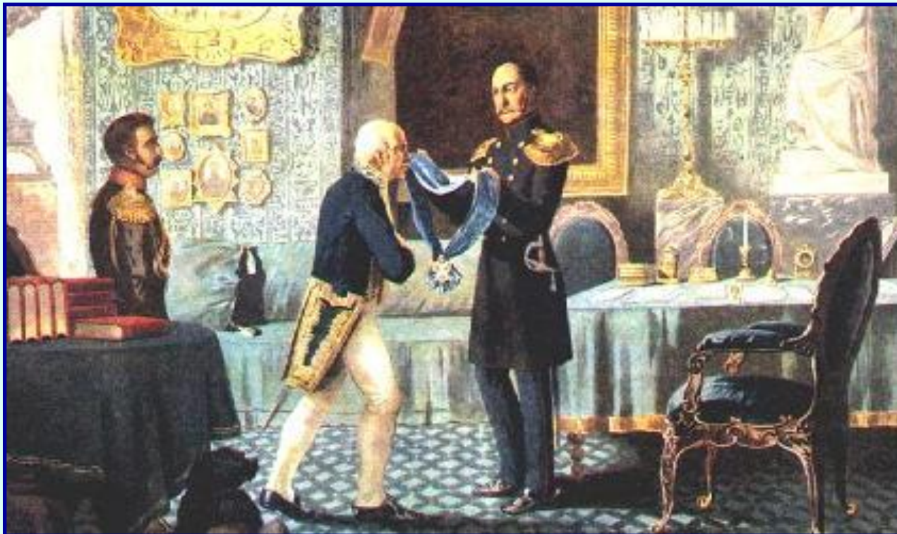
Николай I вручает Орден Андрея Первозванного М.Сперанскому

В 1826 г. Николай I вернул из ссылки М.М.Сперанского и поставил его во главе II отделения канцелярии, занимавшемся подготовкой и совершенствованию законов. М.Сперанскому было поручено подготовить единый Свод законов страны. В 1830 г. появилось 1-е Полное собрание законов Российской империи в 45 томах, а в 1833 г. - Свод действующих законов.