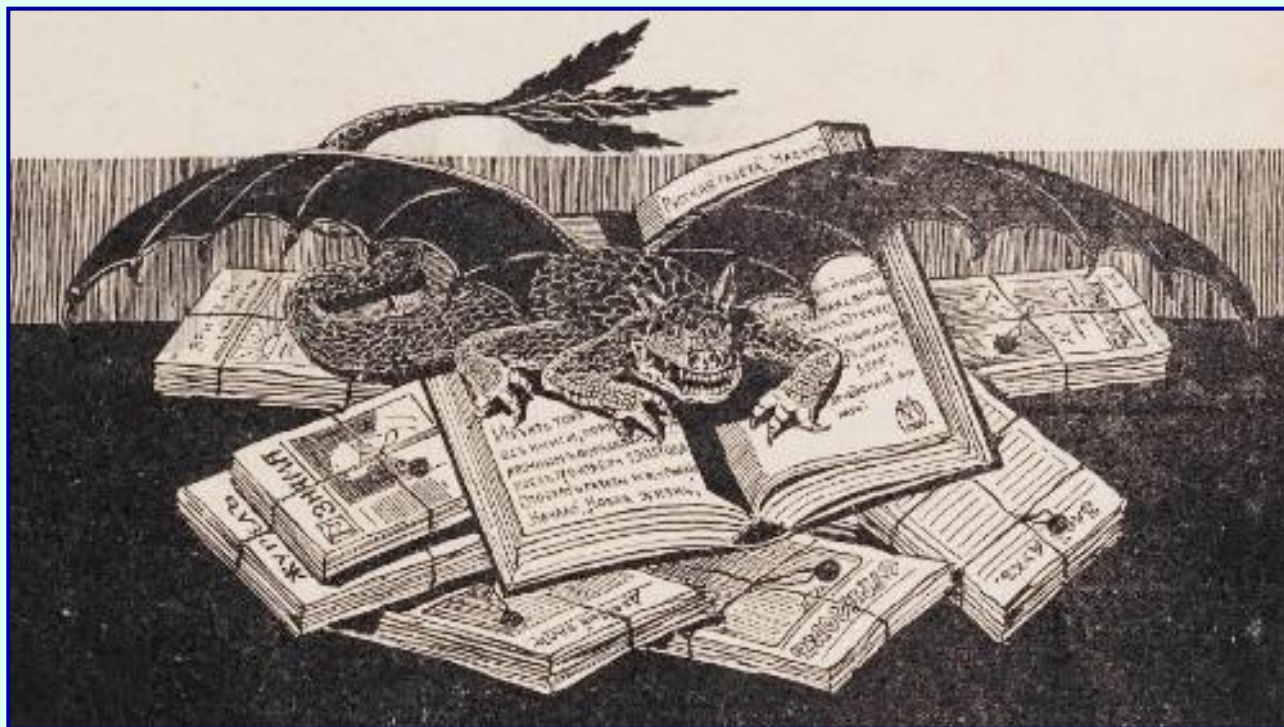
Карикатура на «чугунный» устав

В 1826 г. был издан цензурный устав, поставивший печать под жесткий контроль государства. Современники назвали этот устав «чугунным», так как он вводил множество запретов и ограничивал возможности журналистов, писателей, поэтов высказывать антиправительственные мнения.