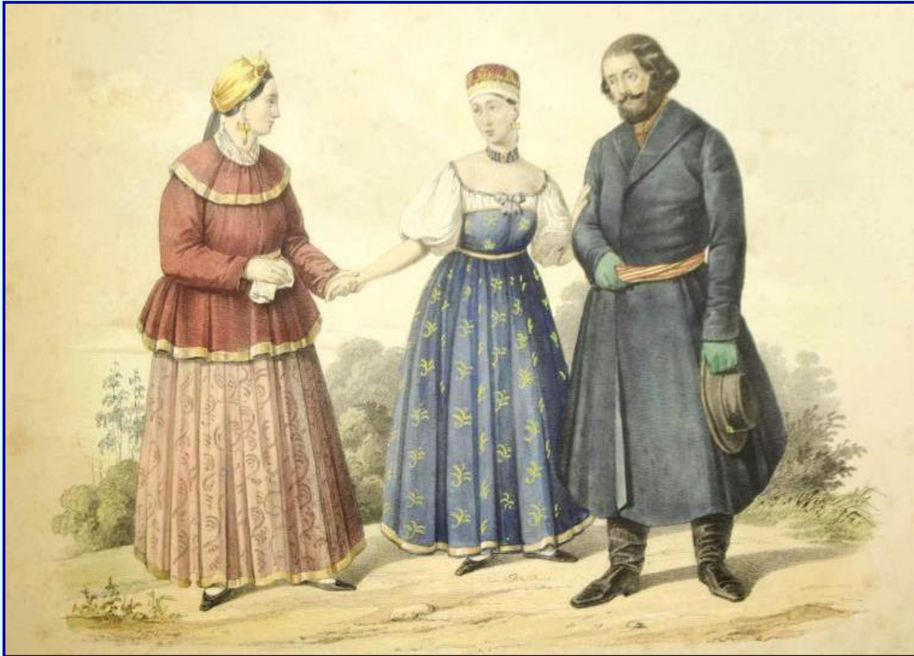
Крестьяне 19 в.

Николай I не мог не уделять внимания крестьянскому вопросу. Он решил начать с преобразований, направленных на улучшение положения государственных крестьян.