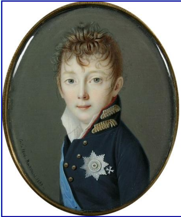
Николай I в детстве

Николай I - младший сын Павла I родился в 1796 г.