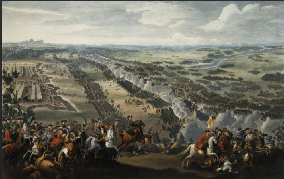
Денис Мартен. Полтавская битва. 1726