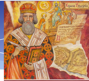
Кірыла Тураўскі (каля 1130-1182)