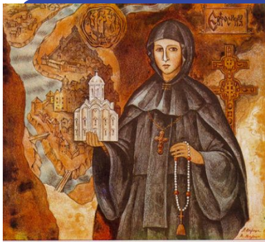
Еуфрасіня Полацкая (каля 1102-1173)