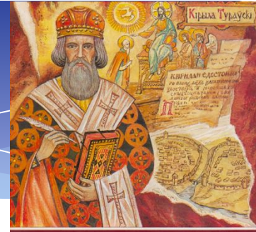
Кірыла Тураўскі (каля 1130-1182)