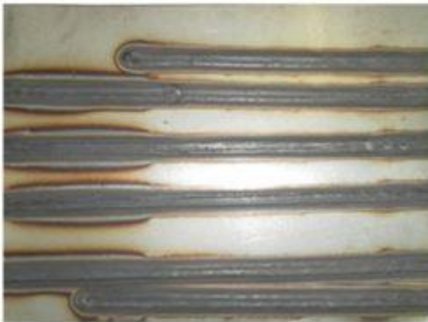
До обработки травильной пастой