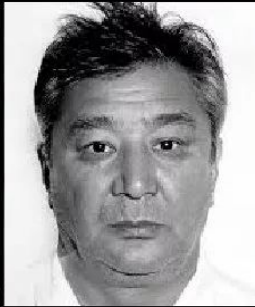
Алимжан Тохтахунов (Тайванчик, Алик)