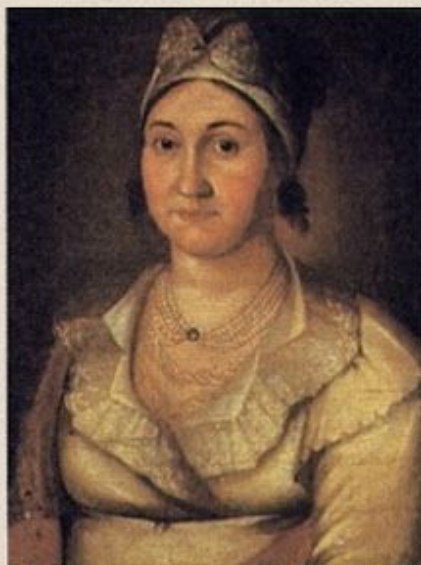
Авдотья Матвеевна Гончарова, мать писателя.