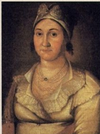
Авдотья Матвеевна Гончарова, мать писателя.