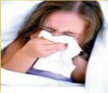
Сильный насморк с гнойными выделениями зеленого цвета