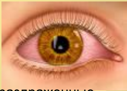
раздраженные красные глаза