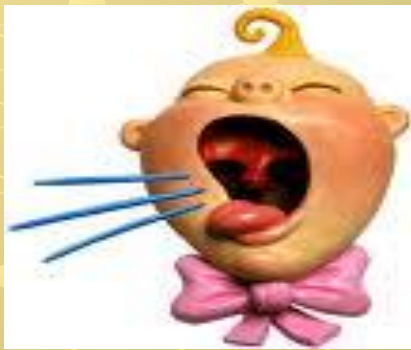
Сильный и сухой кашель

Сыпь появляется на носу и за ушами, переходит на лицо, спускается на шею и грудь; затем переходит на туловище и руки и, в конце концов, появляется на ногах. За 3 суток охватывает все тело