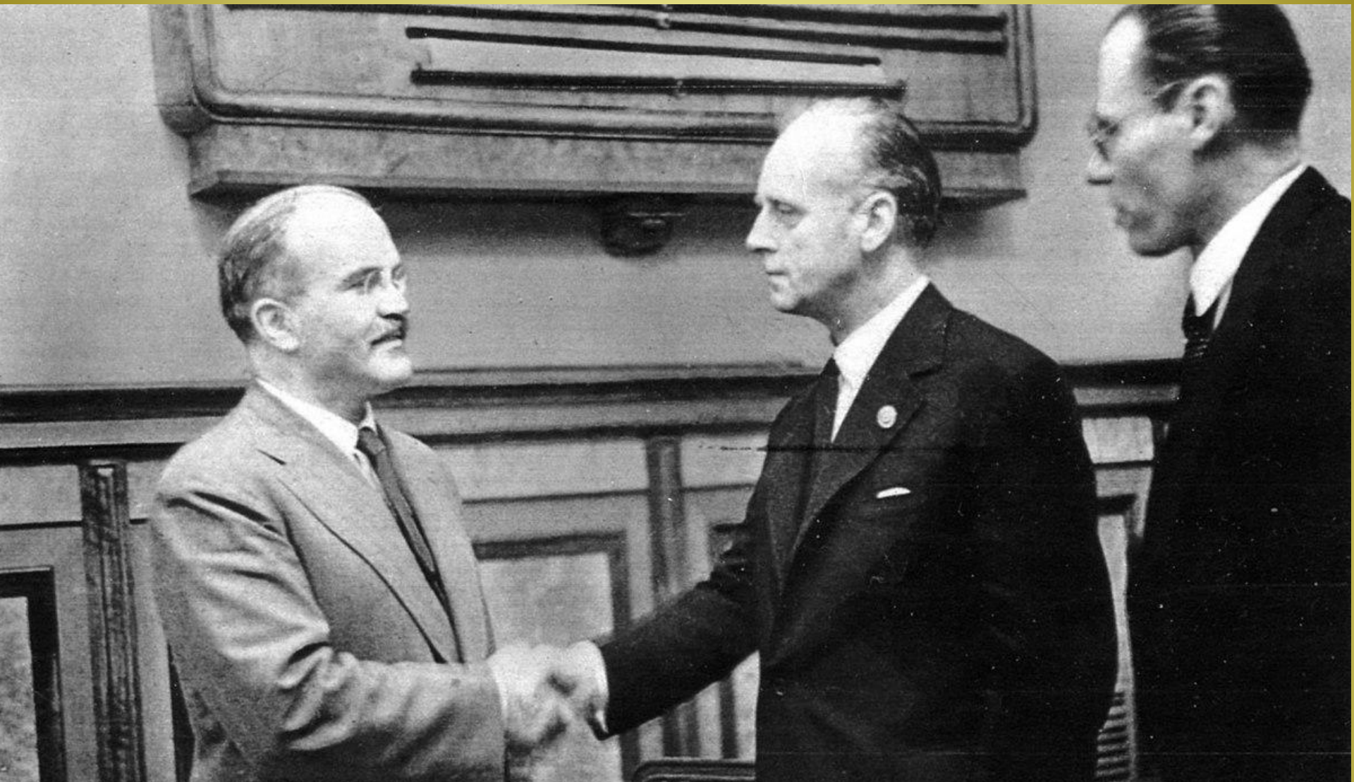
Вячеслав Михайлович Молотов (1890- 1986 гг.) – советский политический деятель, министр иностраннх дел СССР в 1939- 1956 гг.