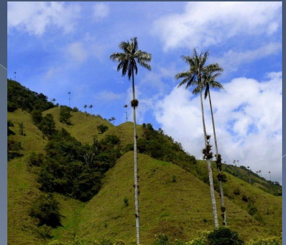
Пальмы Ceroxylon quindiuense