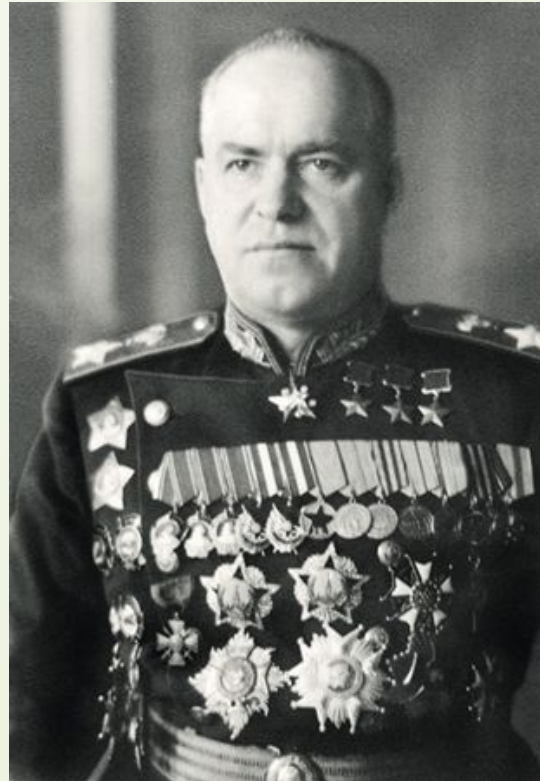
Георгий Константинович Жуков

16. Назовите ФИО полководца, изображенного на фотографии.