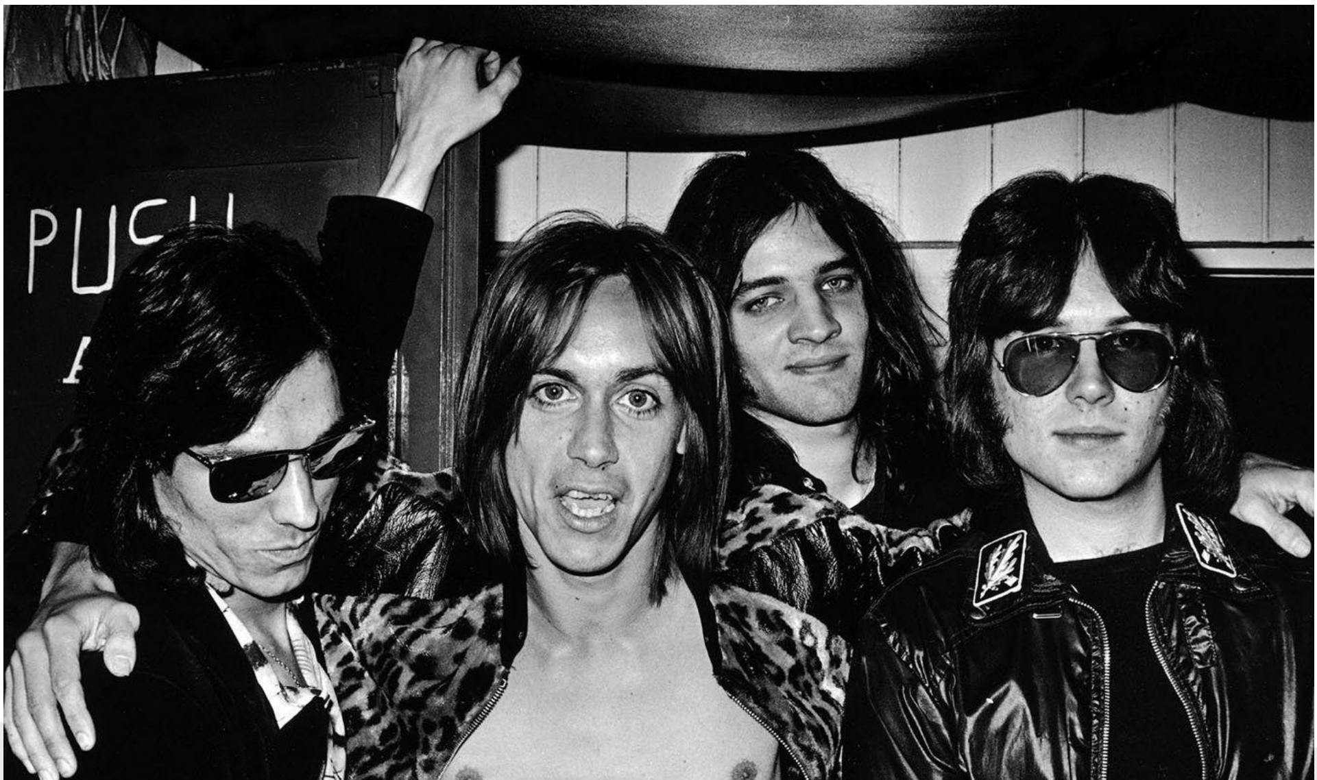
Группа "The Stooges"