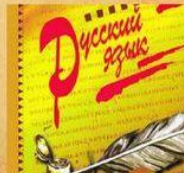
XVII в. язык русской нации