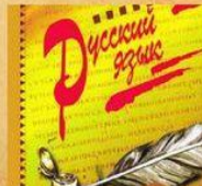
XVII в. язык русской нации