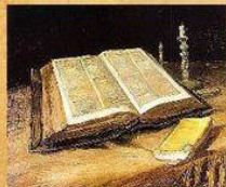
XIV-XVII вв. язык великорусской народности