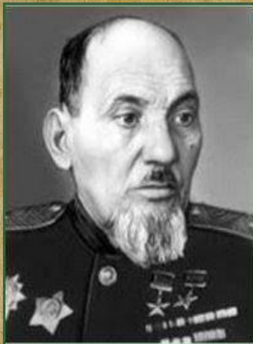
Сидор Артемович Ковпак