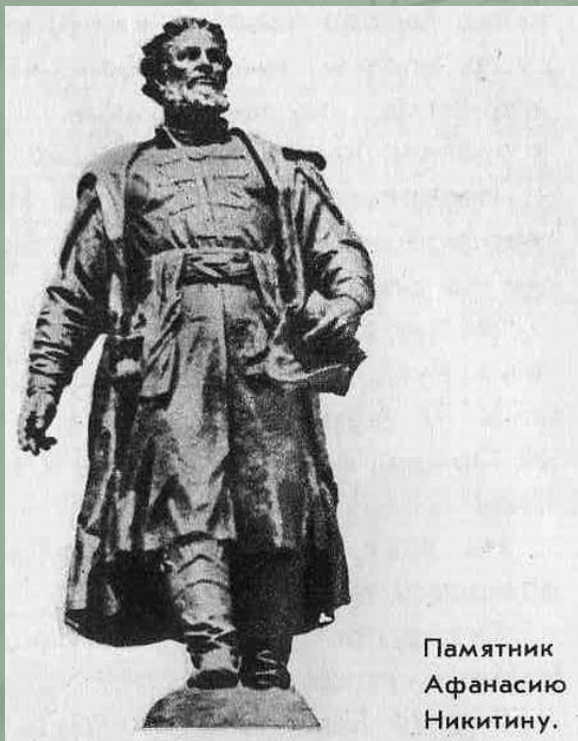
Памятник Афанасию Никитину.