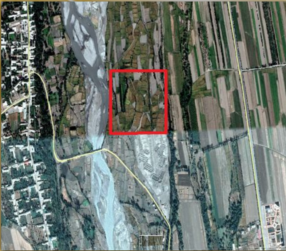
1:10 000 масштабли харитасидан кўчирма