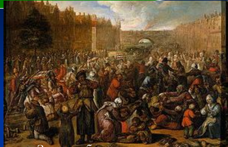
Зняття облоги з Дейлена

Початок партизанської війни проти іспанських військ