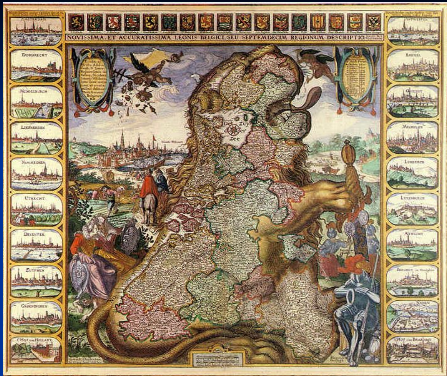
Карта повсталих провінцій