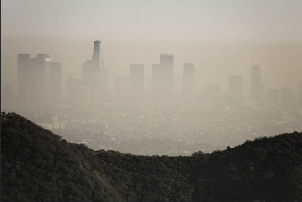
Смог над Лос-Анджелесом