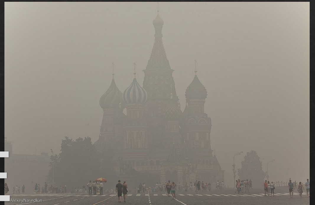
Москва в смоге