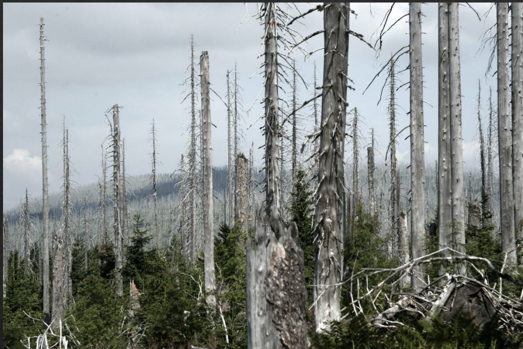
Хвойный лес после кислотного дождя