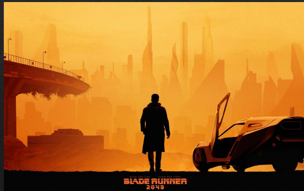
Постер фильма «Бегущий по лезвию 2049»