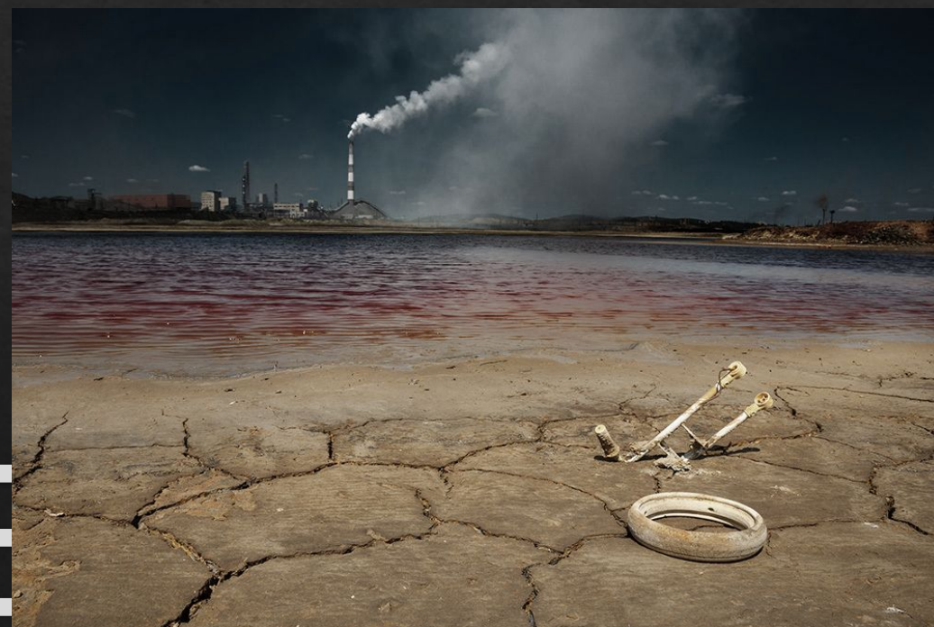
Последствие «соседства» заводов для рек