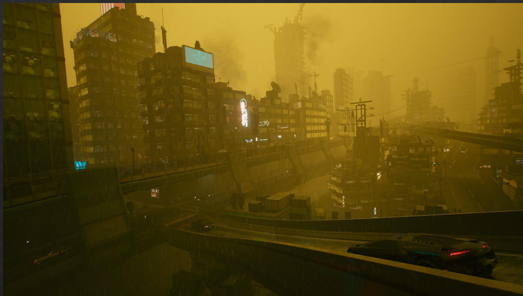
Кислотный дождь в игре «CyberPunk 2077»