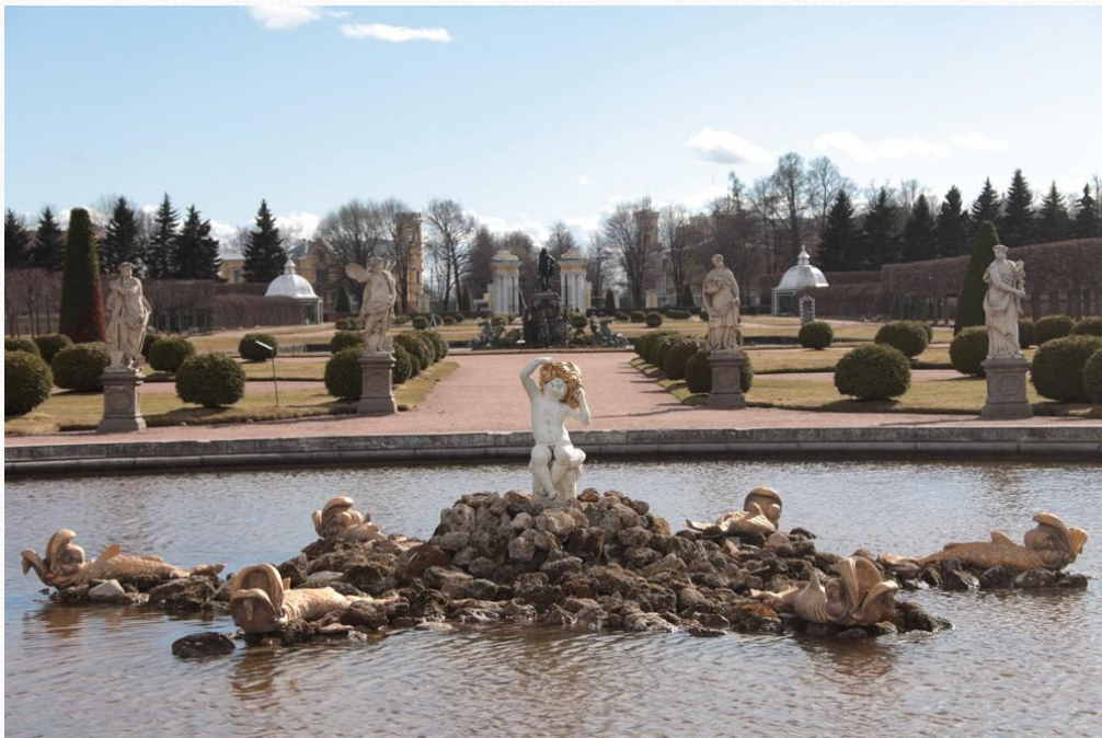
Дубовый – Амур, окруженный шестью дельфинами