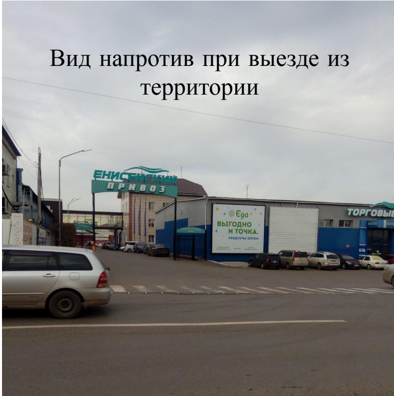
Вид напротив при выезде из территории