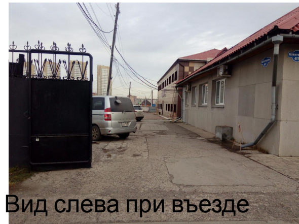
Вид слева при въезде

Помещение без арендаторов находится на выделенной территории Енисейского рынка. На сегодняшний день собственник разрешает арендаторам соседнего здания использовать данное место под парковку. В случае заключения договора автомобили, стоящие у помещения будут убраны.