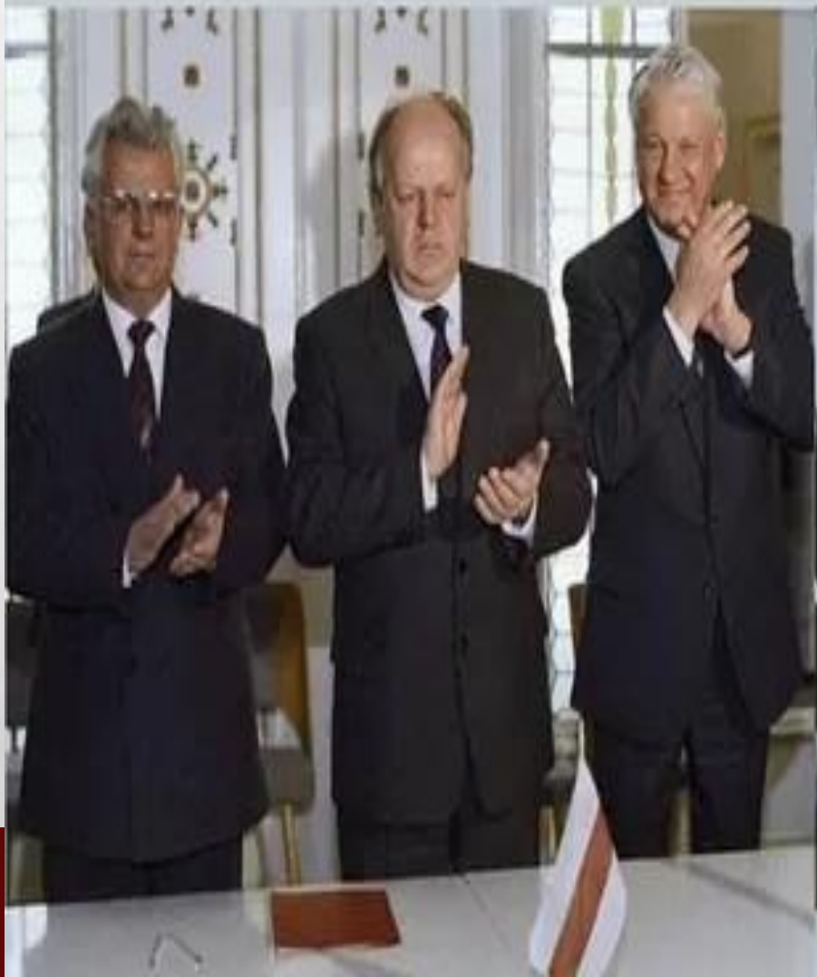
Л. Кравчук С. Шушкевич Б. Ельцин