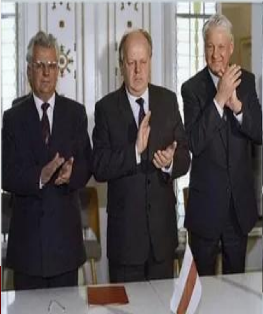
Л. Кравчук С. Шушкевич Б. Ельцин