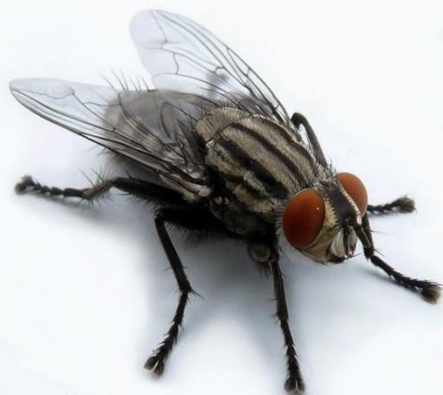
Үй шыбыны Муха домашняя