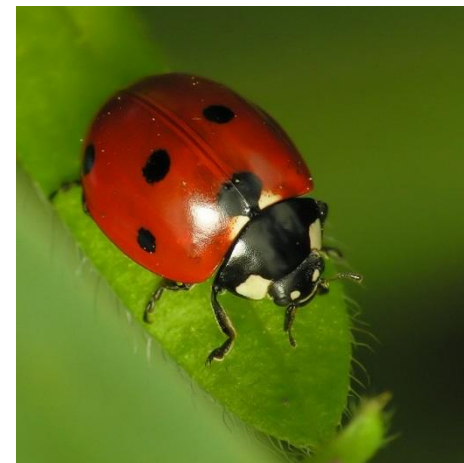
Жетінүктелі қанқыз Божья коровка