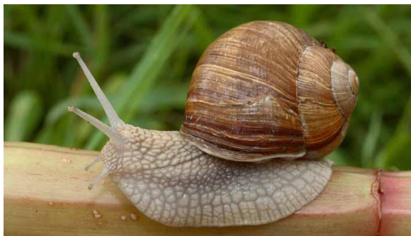
Жүзім ұлуы Виноградная улитка