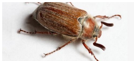
Зауза қоңызы Майский жук