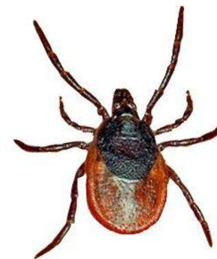
Тайга кенесі Таежный клещ