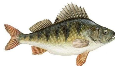
Өзен алабұғасы Речной окунь