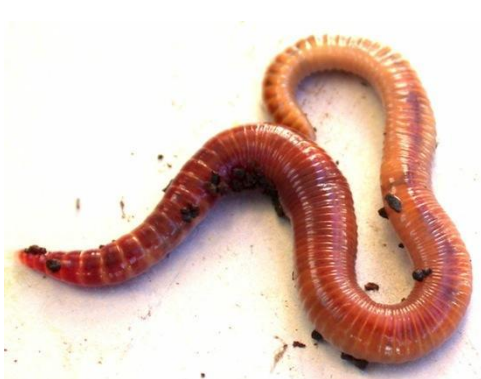
Жауын құрты Дождевой червь