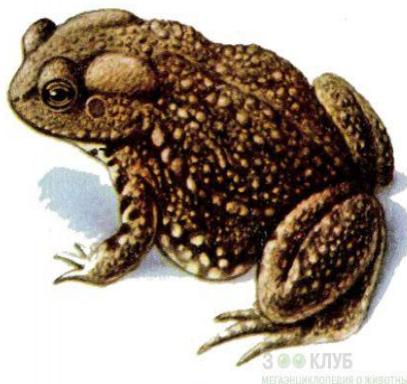
Сұр бақа Серая жаба