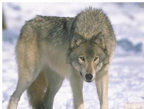
Сұр қасқыр Серый волк