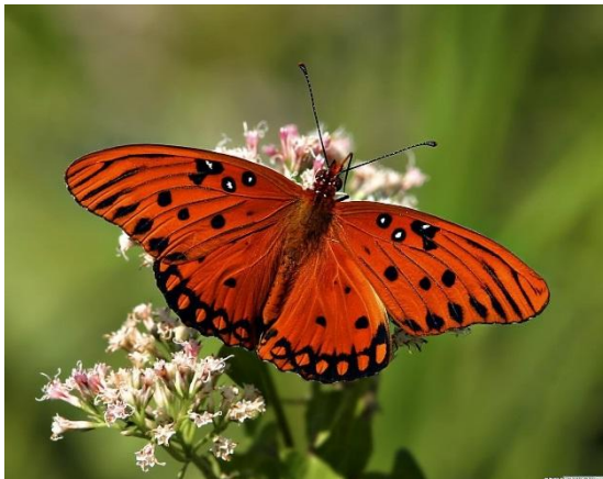
Қызыл көбелек Красная бабочка