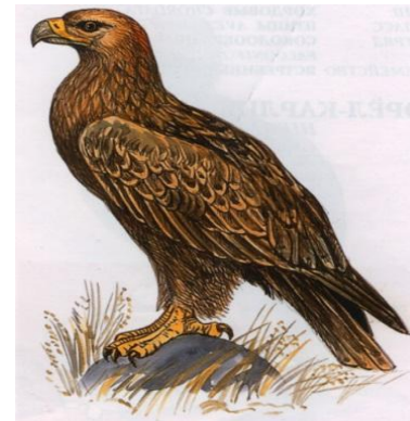
Дала қыраны Степной орел