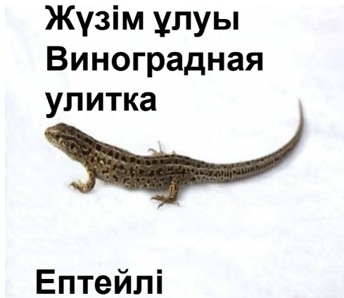
Ептейлі кесіртке Прыткая