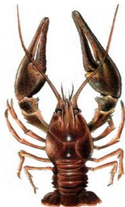
Өзен шаяны Речной рак