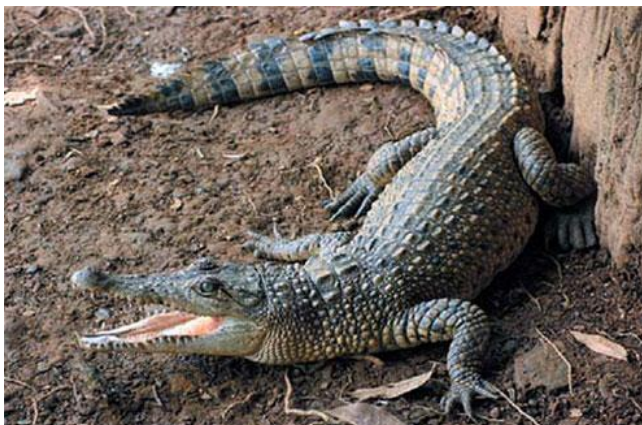
Нағыз қолтырауын Крокодил настоящий