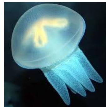
Көгілдір медуза Голубая медуза