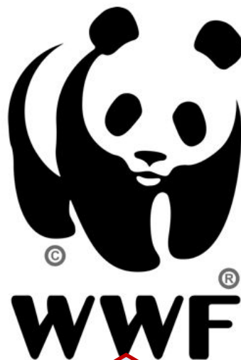
Природоохранная организация «Всемирный