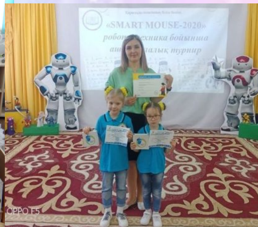
Робототехника «MOUSE тышқан» үйрмесі