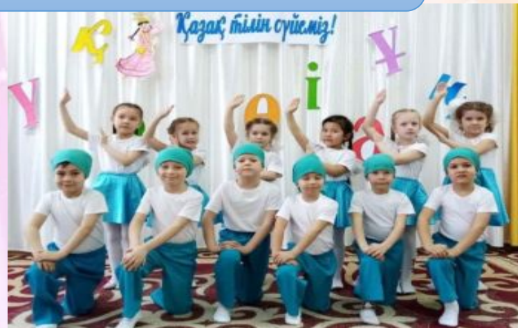
«Би әліппесі» үйрмесі