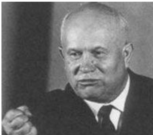
Усиление позиций Хрущева – ослабление Маленкова.