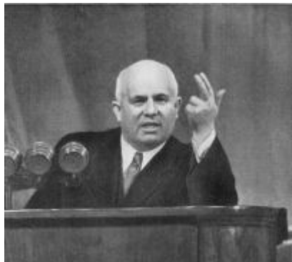
Первый секретарь ЦК КПСС

Один из виновников «Ленинградского дела»