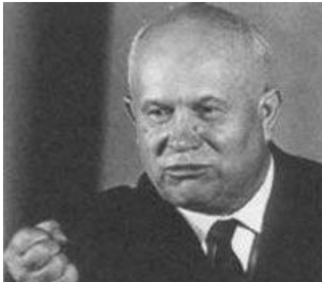
Усиление позиций Хрущева – ослабление Маленкова.