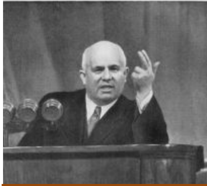
Первый секретарь ЦК КПСС

Один из виновников «Ленинградского дела»