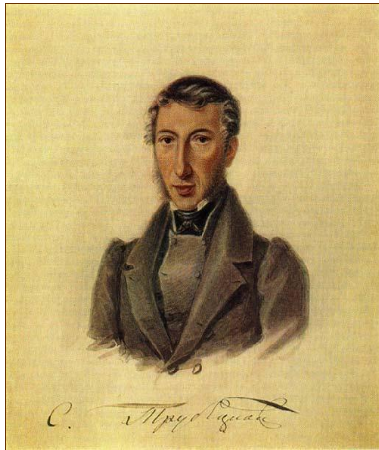
Сергей Петрович Трубецкой