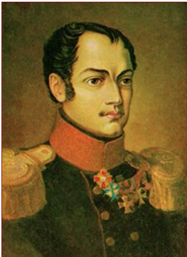
Павел Иванович Пестель