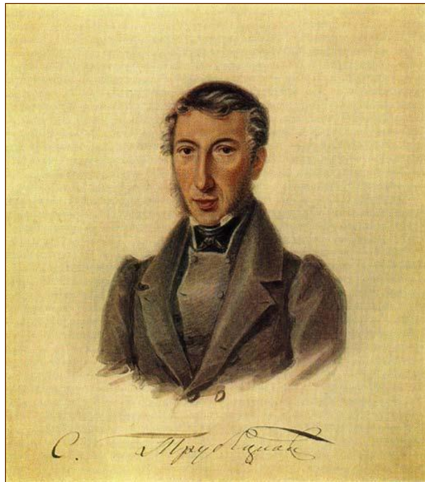
Сергей Петрович Трубецкой