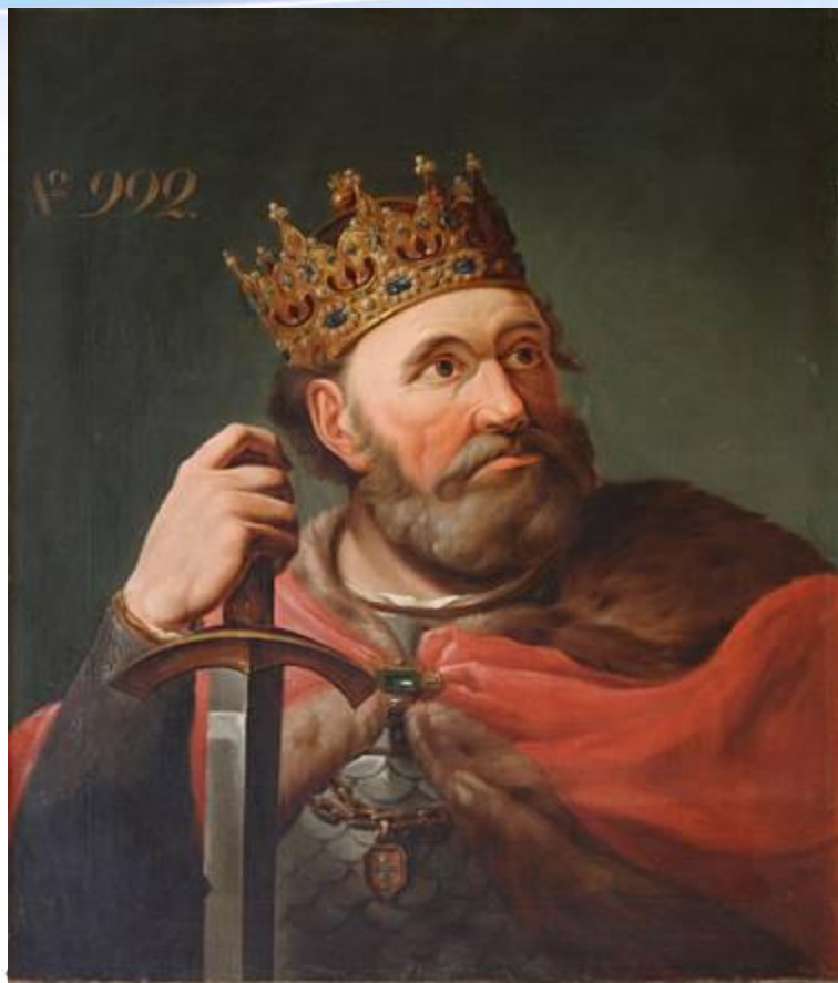
Болеслав I Храбрый

Объединение Польши завершилось в годы правления Болеслава I Храброго (992—1025). Ему удалось присоединить южные польские земли. В город Краков — крупный торговый центр на пути из Киева в Прагу — была перенесена столица Польши. Болеславу I на время удалось захватить Чехию с Прагой, но вскоре Чехия освободилась от его власти