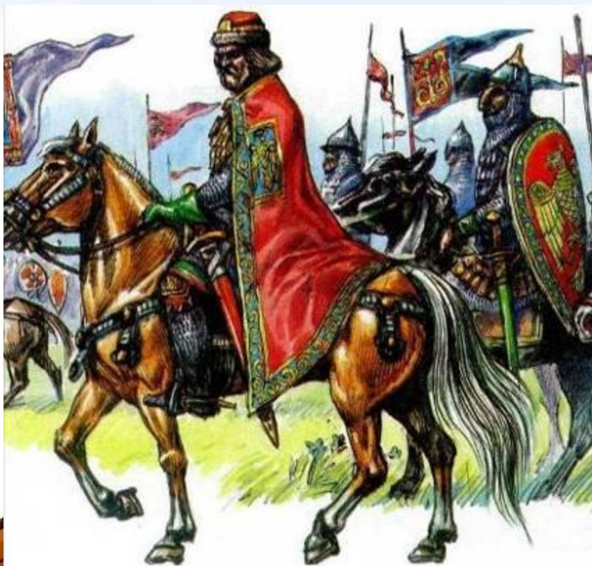
Князь с дружиной