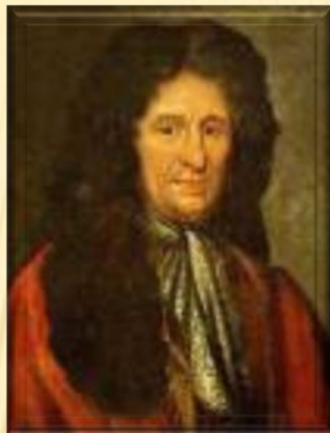
Жан де Лафонтен