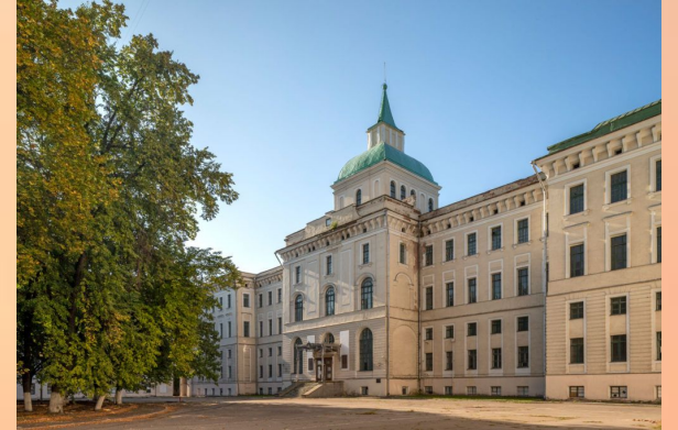
Смольный институт благородных девиц