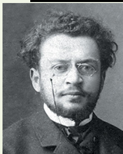
- Иоффе А.А.