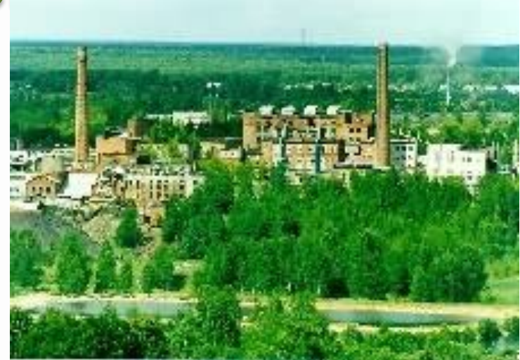
Кинешма. Лесохимический завод.

Лесохимическая промышленность основана на химической переработке древесины. К ней относятся: сухая перегонка древесины, углежжение (получение древесного угля) и различные виды канифольно-скипидарных производств