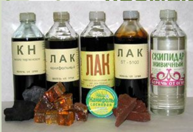
Продукция лесохимической промышленности