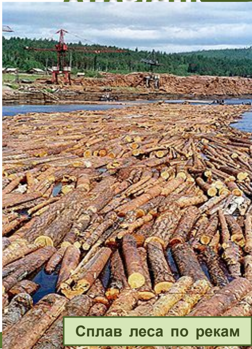
Сплав леса по рекам