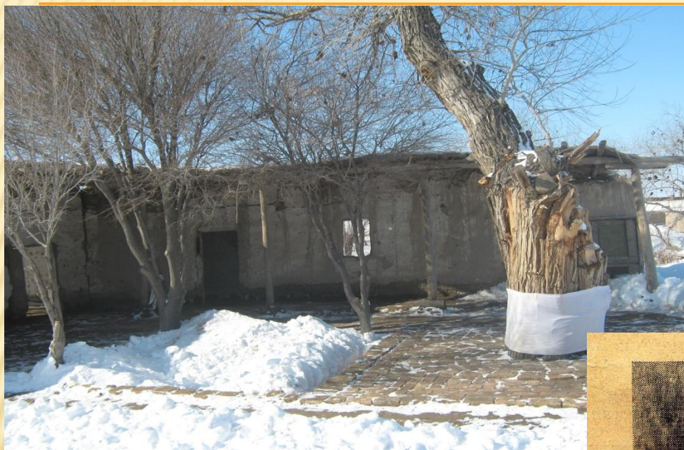
Shimbaydag'I XIX a'sir ortalarinda saling'an Xan meshiti

1924-1925-jilda saling'an shimbaydag'i birinshi sovet mektebi.