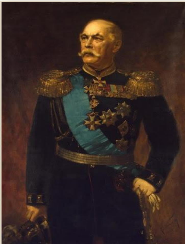
Э. И. Тотлебен