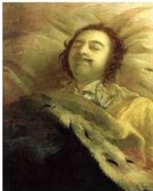
И. Н. Никитин «Пётр I на смертном одре»