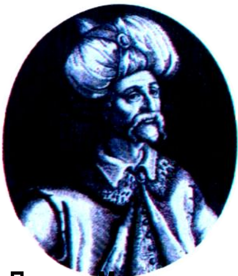
Пророк Мухаммед. Французская гравюра 17 в.