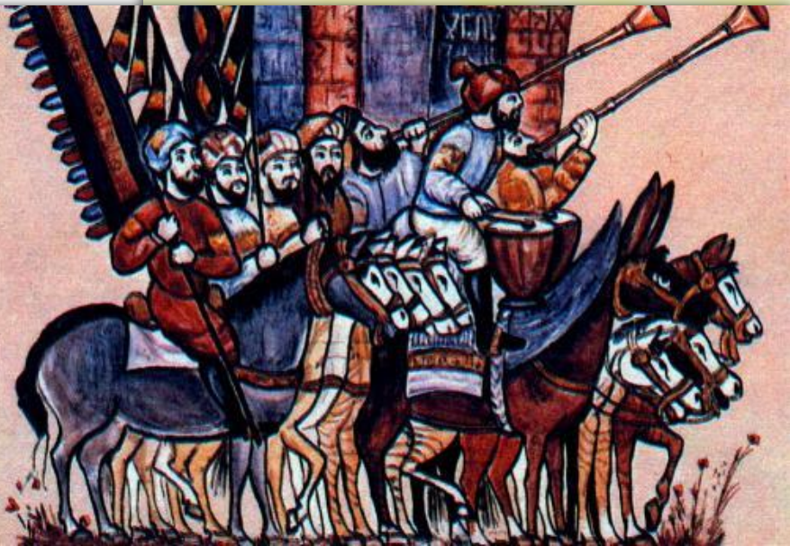
Арабы в походе