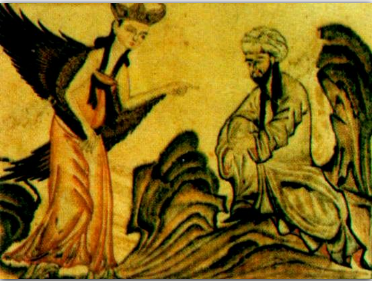
Ангел Джабраил объявляет Мухаммеду, что он - пророк.

В 6 в. Аравия потеряла ряд территорий, торговля была нарушена.