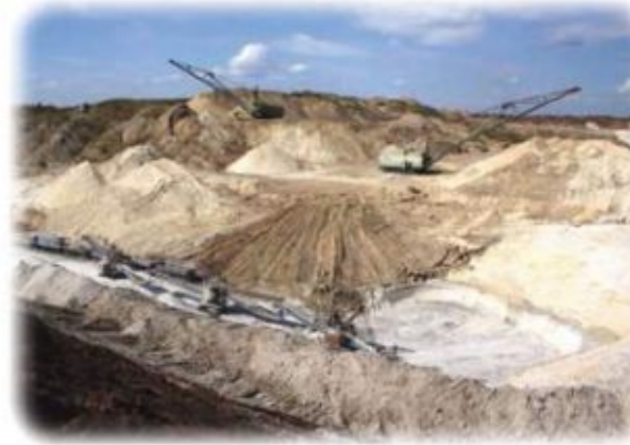
Видобуток корисних копалин