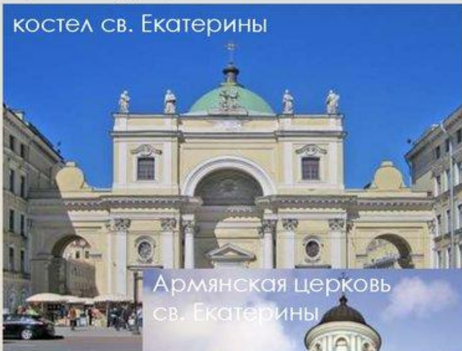
Армянская церковь св. Екатерины