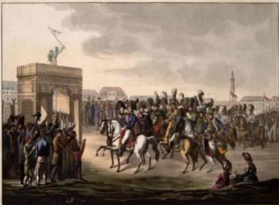
ИМПЕРАТОР АЛЕКСАНДР I ВХОДИТ В ПАРИЖ НА БЕЛОМ КОНЕ

31 марта 1814 года войска коалиции вошли в Париж. Верхом на белом коне ехал русский император Александр I.