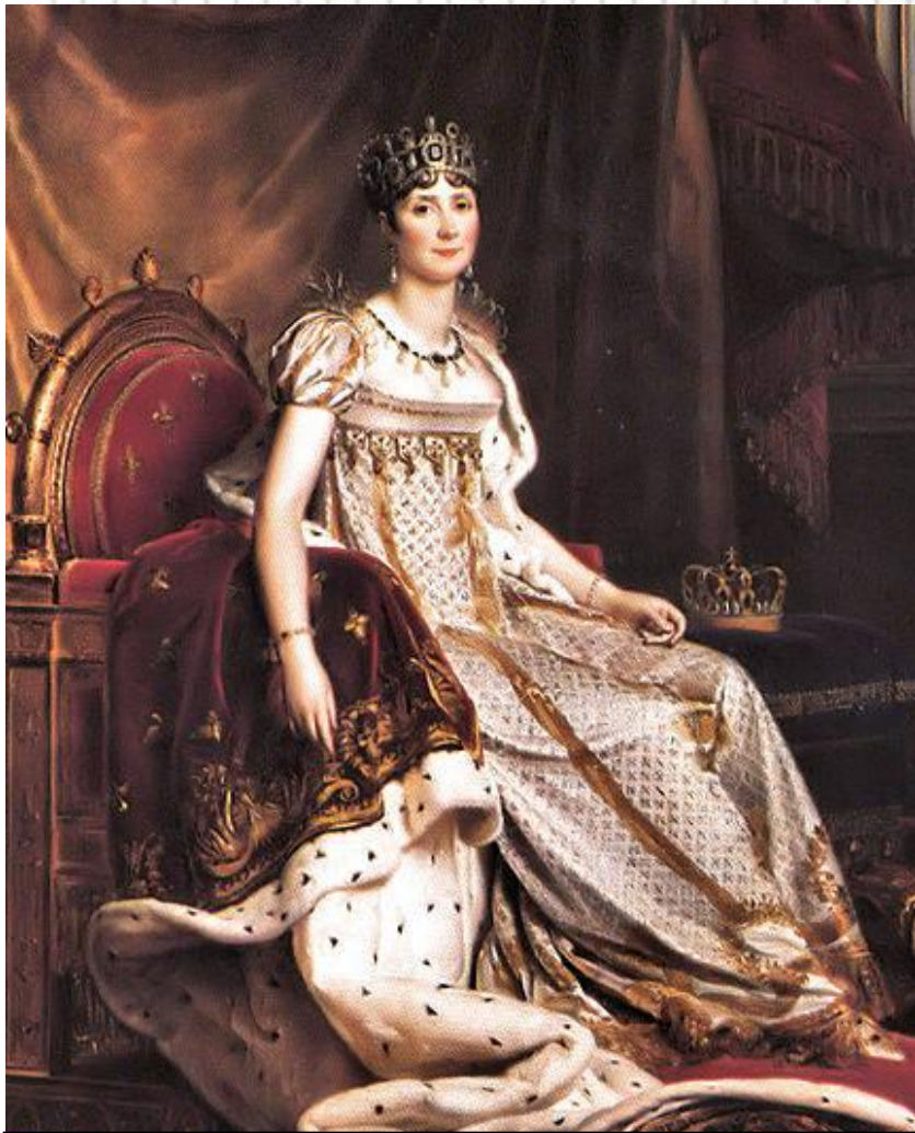
Жозефина, первая жена Наполеона

В распоряжении Наполеона было три королевских дворца, к национальным французским праздникам прибавился ещё один – день рождения императора, к его жене, Жозефине, обращались « мадам »