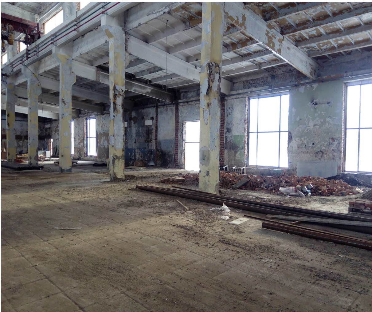
Вид до выполнения работ

Произведен капитальный ремонт помещения с учетом требований для ТТ «Светофор» с возможностью возведения служебных помещений практически в любой точке (коммуникации по всему периметру)