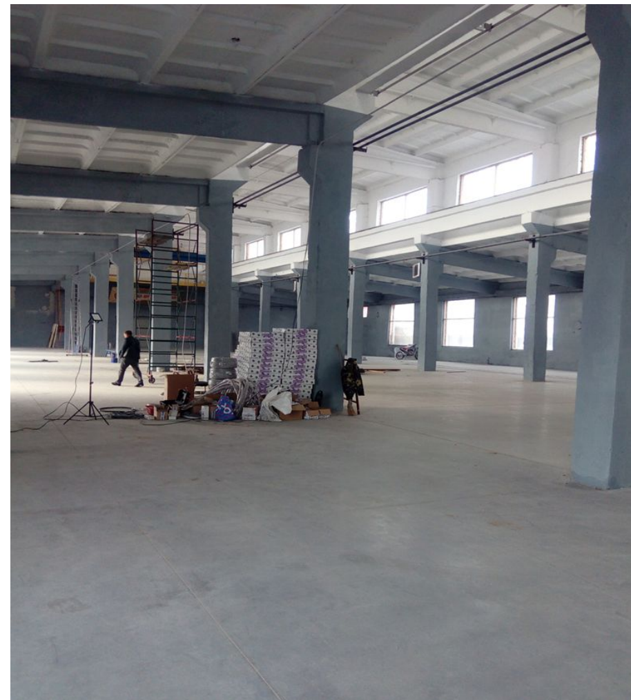
Вид после выполнения работ