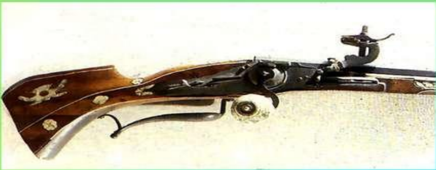
Зброя козаків: шаблі, пістолі, кремнієва рушниця