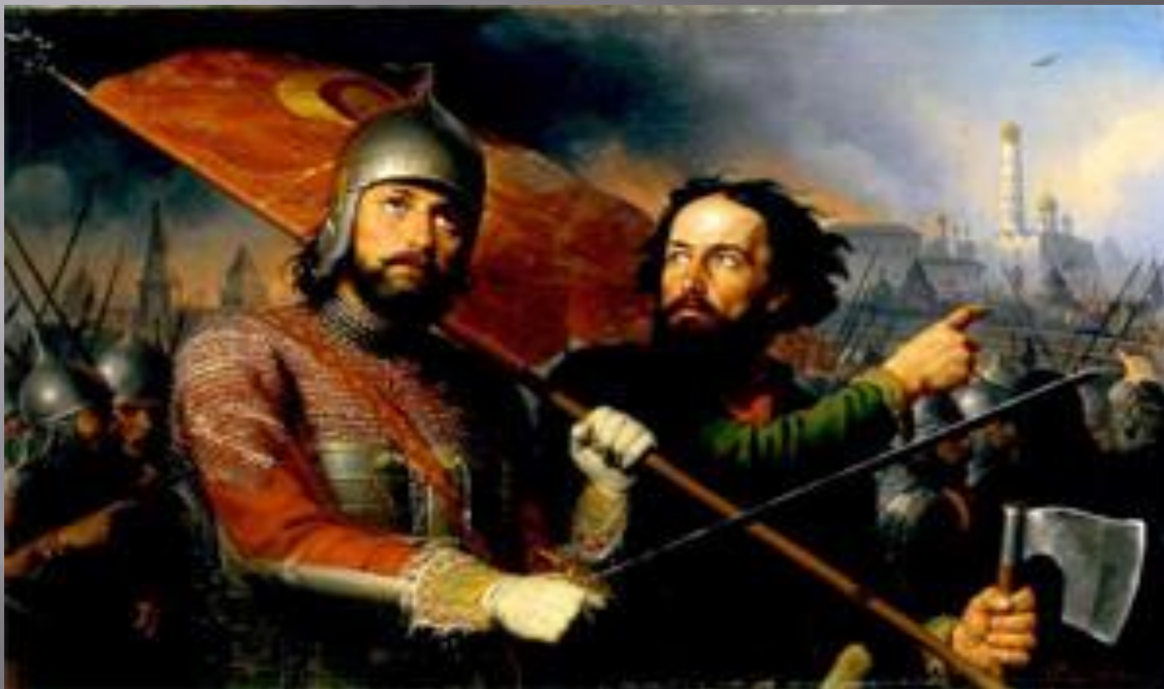
Минин и Пожарский. Художник М.И. Скотти. 1850 г.