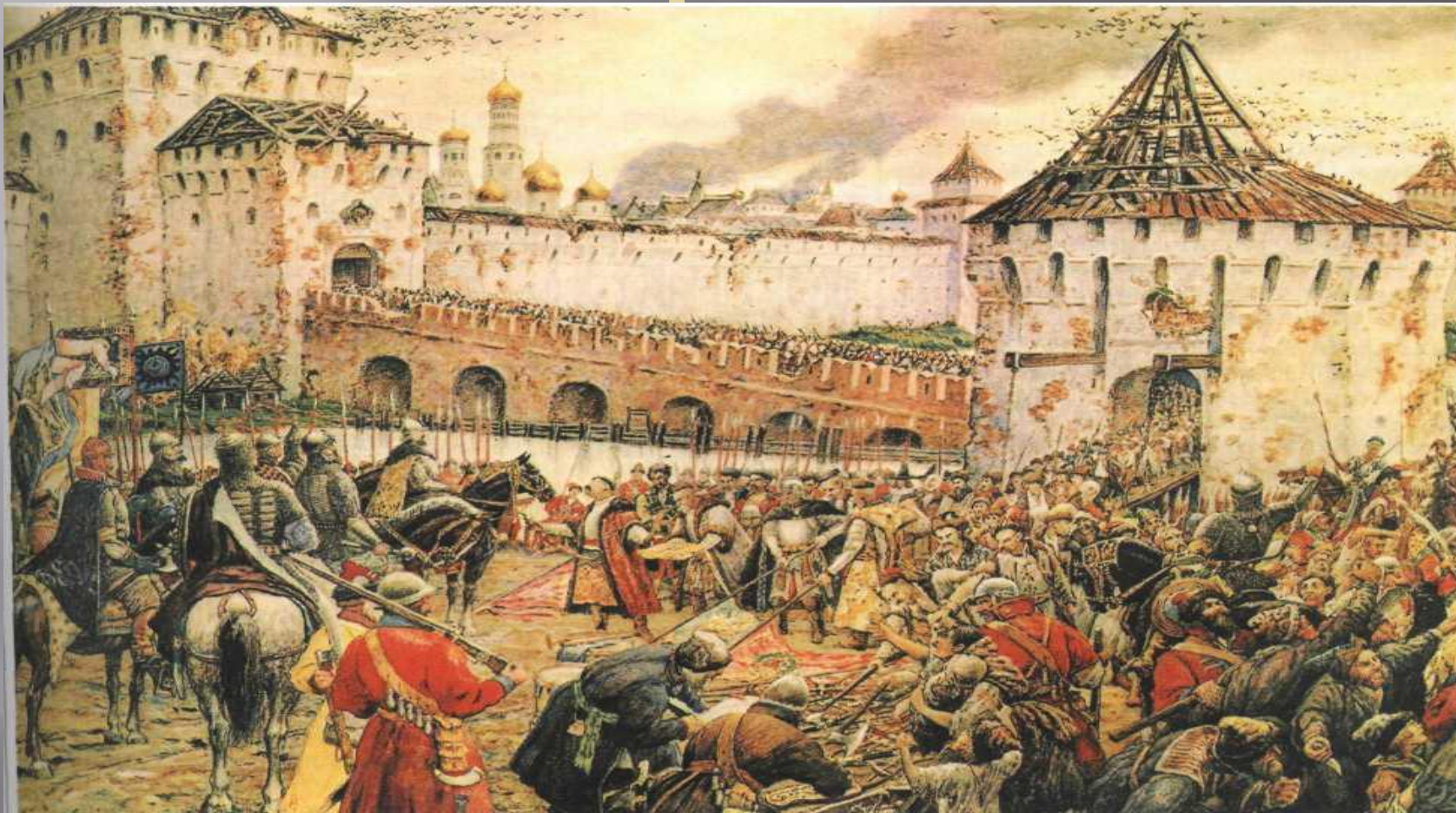
Изгнание польских интервентов из Московского Кремля Художник Э. Лисснер. 19 в.