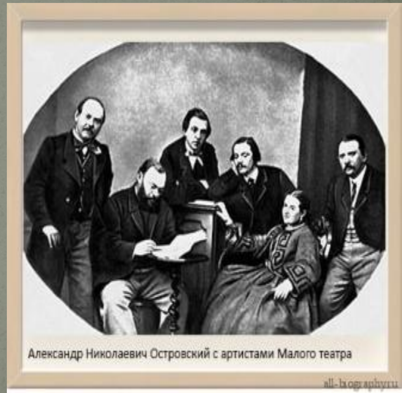
Александр Николаевич Островский с артистами Малого театра

У Островского среди актеров были и противники его нововведений. Такой знаменитый актер, как М. С. Щепкин остался недоволен Островским и даже ушел с генеральной репетиции «Грозы».