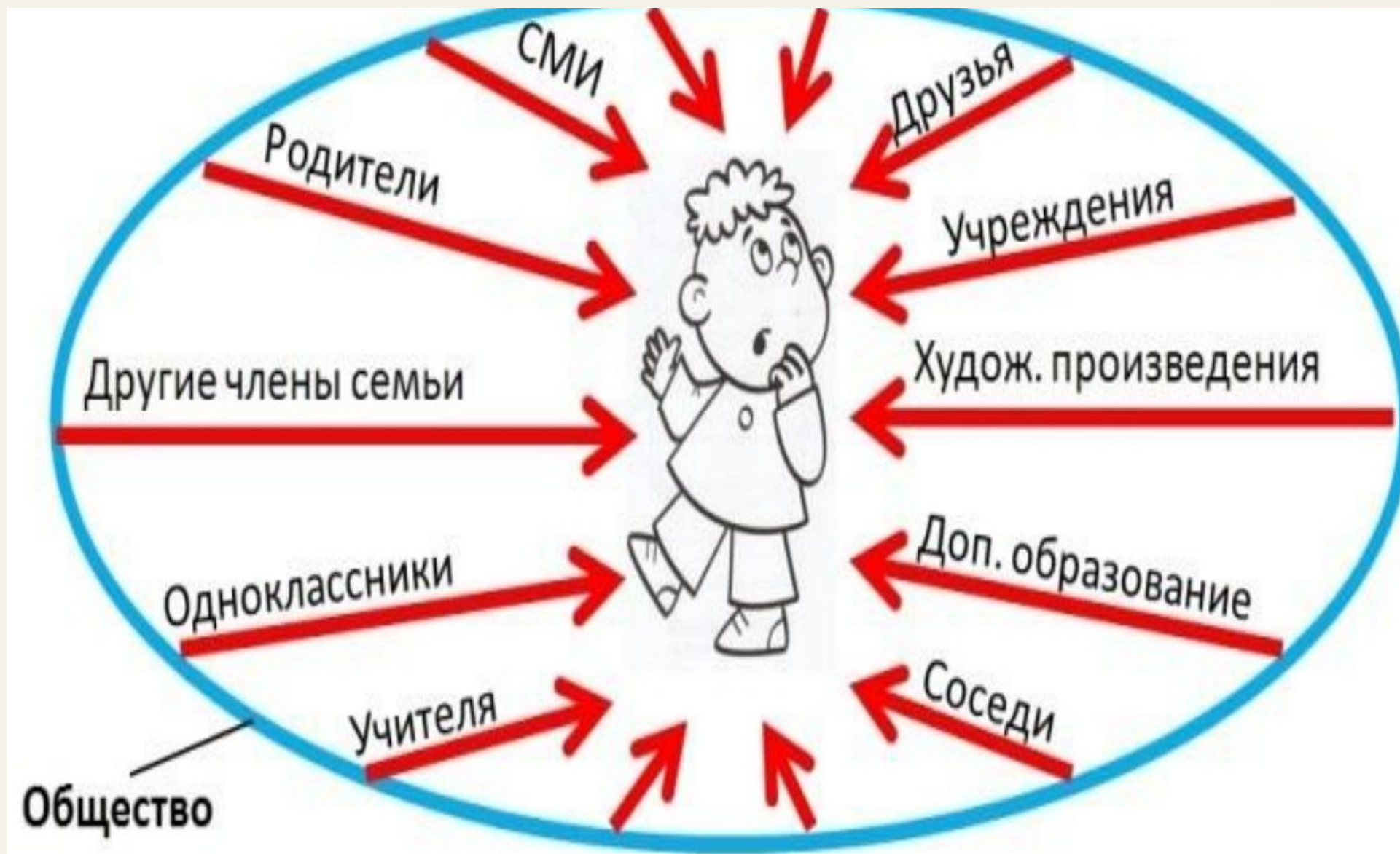
Рис. 1. Воспитание в широком смысле