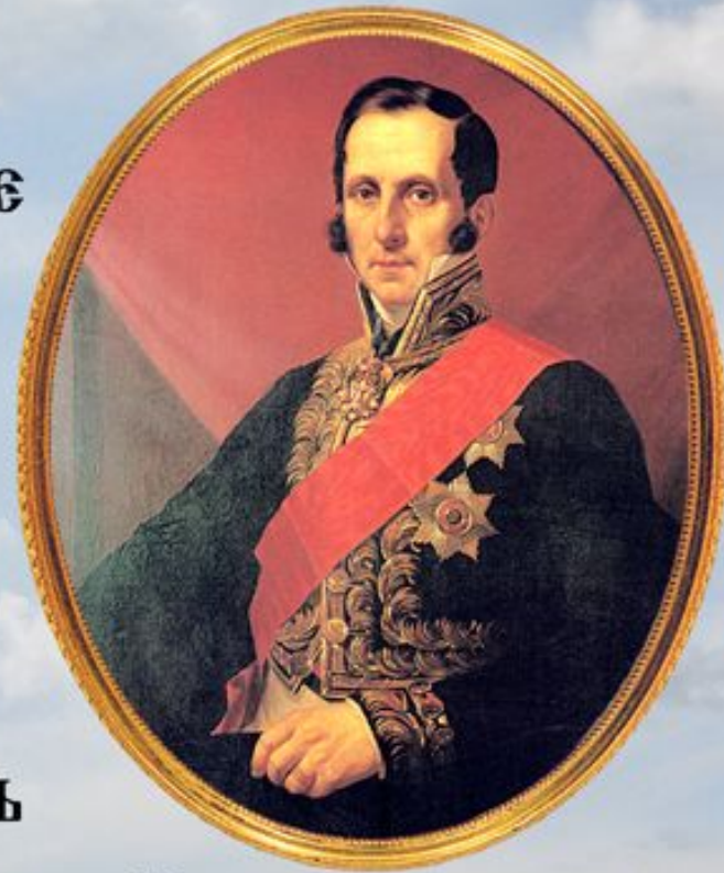
Министр просвещения С.С. Уваров