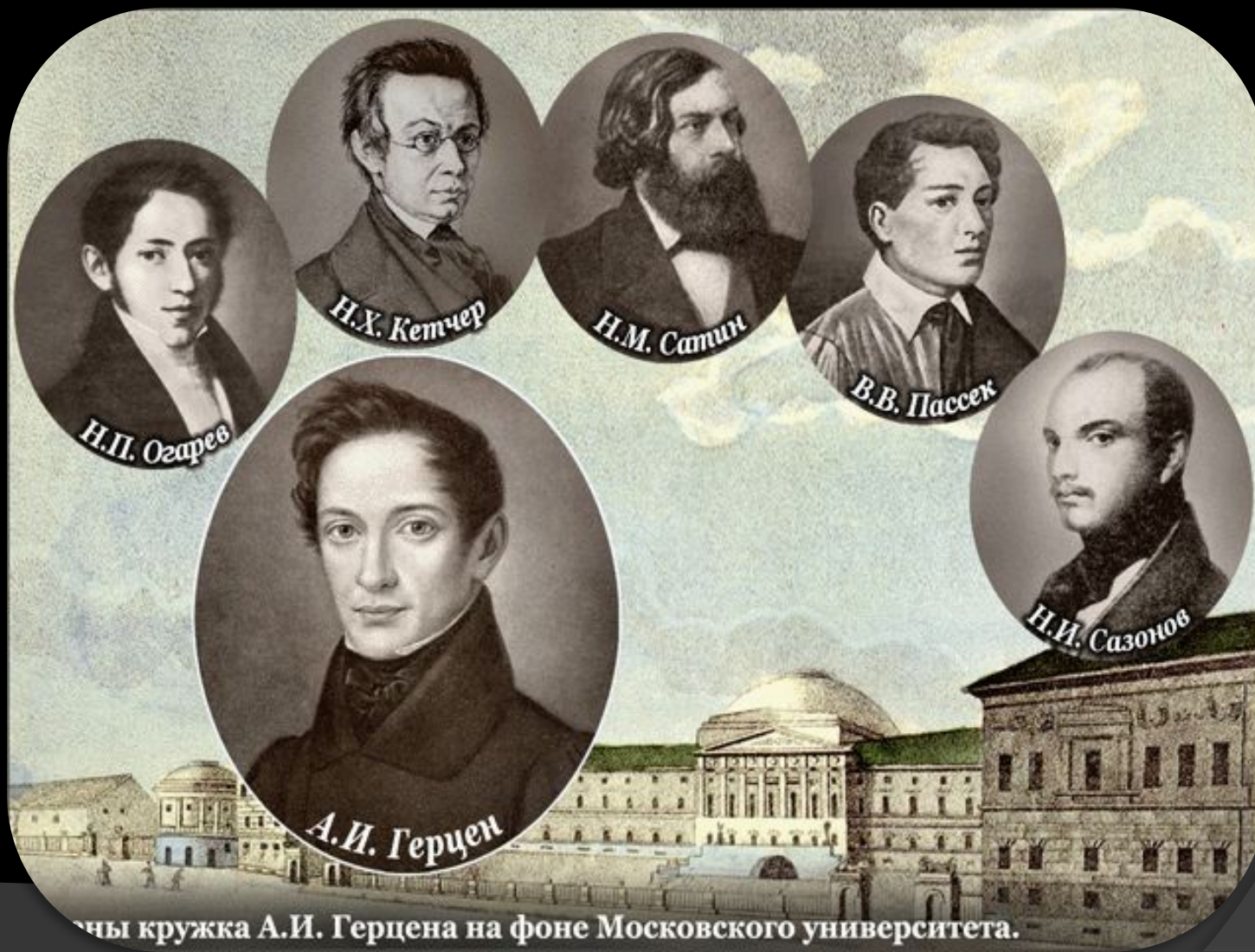
Члены кружка А.И. Герцена на фоне Московского университета.

Домашнее задание: § 12 учить. Готовиться к тесту по § 12.