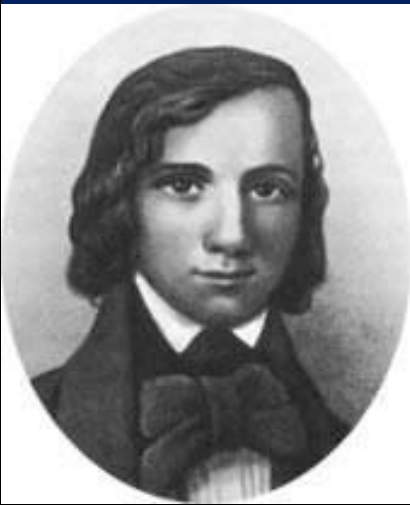
Н. В. Станкевич

Основой революционно-демократического движения с в 20-30-е годы XIX века становятся студенческие кружки.