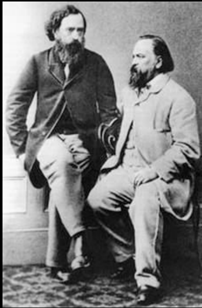
А. И. Герцен и Н. П. Огарев