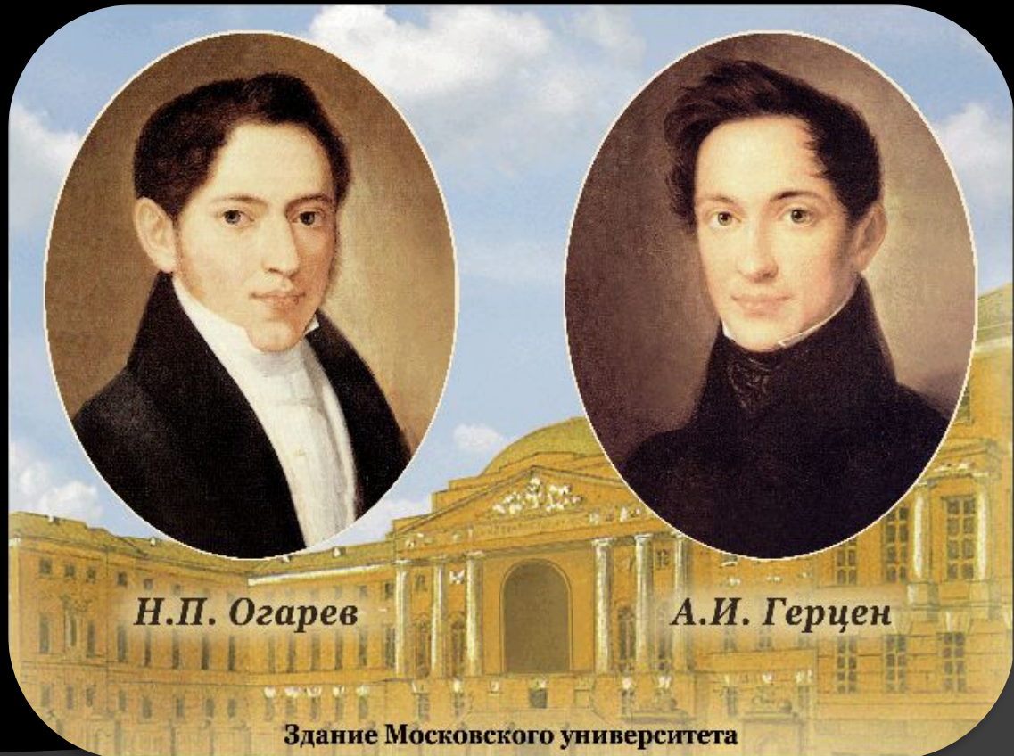
Н. П. Огарев